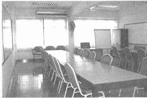
Gambar 3 Harta sekolah