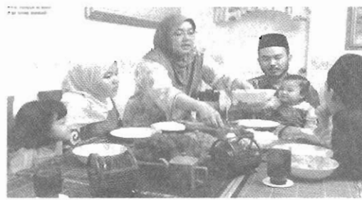
Gambar 2 Suasana pagi raya.